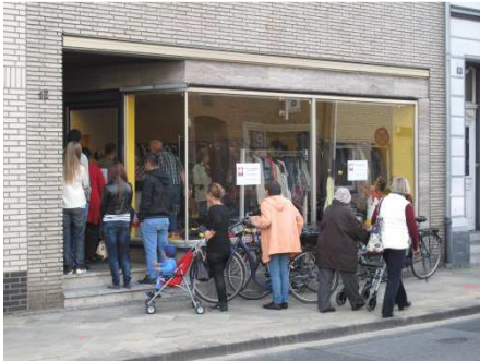
Umzug der Kleiderkammer