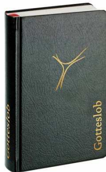
Schmuckausg. schwarz (Cryluxe®-Einband) mit Goldprägung Best. Nr. 60-151284 € 25,00