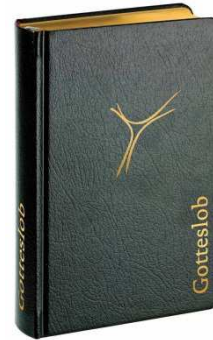
Leder Ausgabe schwarz mit Goldschnitt und Goldprägung Best. Nr. 60-151285 € 35,00

neue Gotteslob in unseren Gottesdiensten zu nutzen.